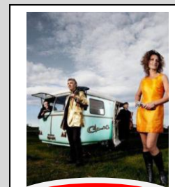
Claus & Co