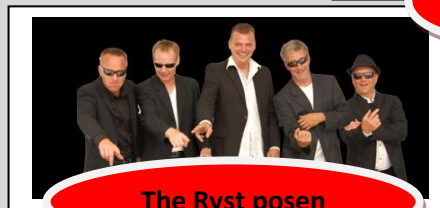
The Ryst posen